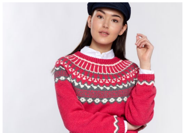
Prøv genseren i blek-rød | GG 19-06