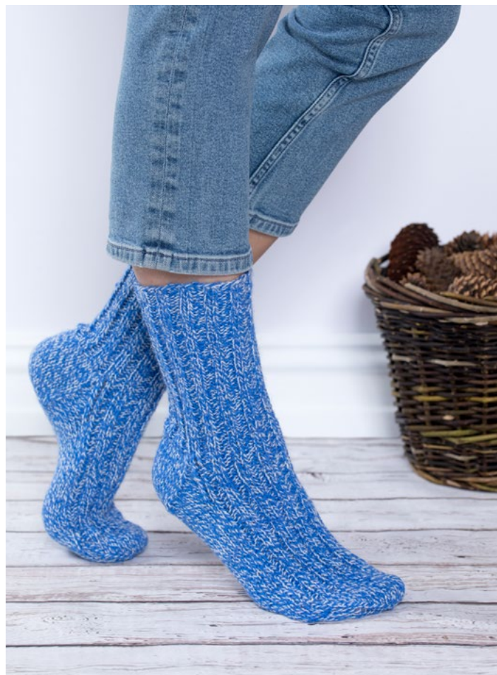
Se også raggsocker | GG275-04