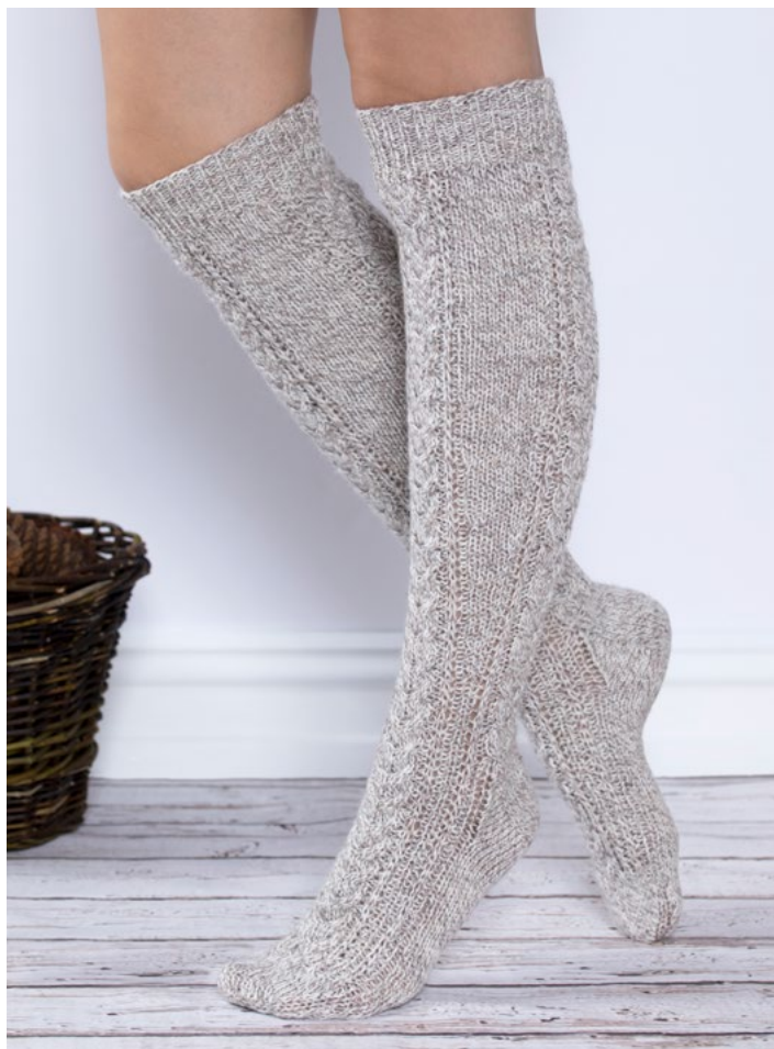
Se også lange strømper | GG275-03